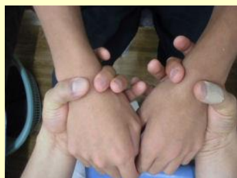
初診時の手首の横径差